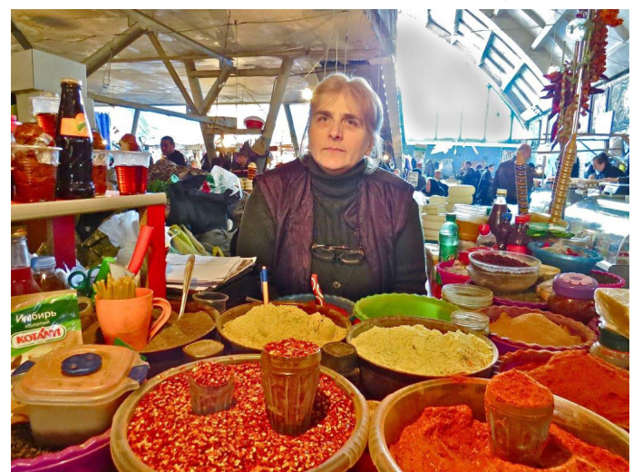
שוק התבלינים קוטיסי

פני האדמה, הזמינו אותו ליהנות ממטעמי השולחן הגיאורגי, והוא כה התלהב, שהחליט לוותר עבורם על החלקה שלו. זו הסיבה, שהם מכנים את ארצם "ארץ האלוהים". וכן, הם מאוד אוהבים לאכול. כבר בקבלת הפנים לאחר נחיתתנו נחשפנו לשלל גבינות, חציל פרוט ברוטב אגוזי מלך, שיפודי עוף וקבב, דגים מטוגנים. במרכז השולחן - החציפורי, מאפה הלחם המקומי, ולצדו - הכיסונים המעודנים, המכונים חינקלי. ארוחה אצל הגיאורגים אינה שלמה בלי יין, וכשיש ציה-ציה, המקבילה של הוודקה, השמחה גדולה שבעתים. על אזורים נרחבים