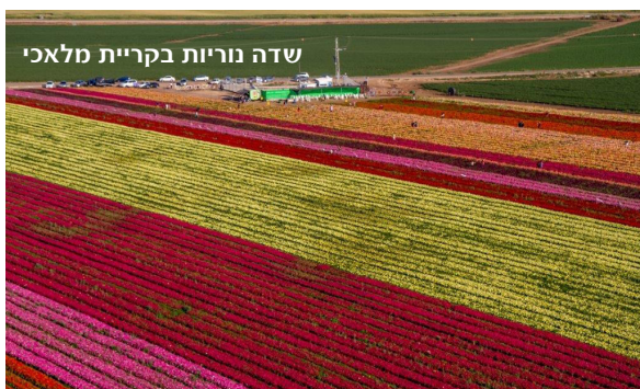
שדה נוריות בקריית מלאכי

לפרטים נוספים אודות התערוכה, הצלם והספר www.skypics.co.il