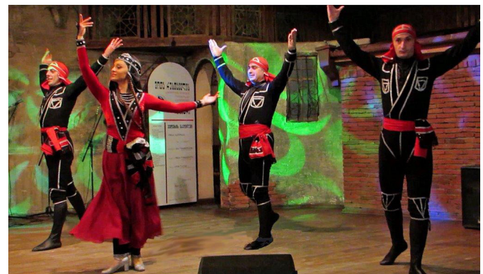
המחוללים סן הקווקז

המחוללים סן הקווקז באזור אגירה, 300 ק"מ מטיביליסי, שוכנת באטומי, עיר קיט לחוף הים השחור. לאורך קילומטרים רבים של הטיילת מאות בתי קפה, מועדונים ומסעדות. גולת הכותרת היא הגנים